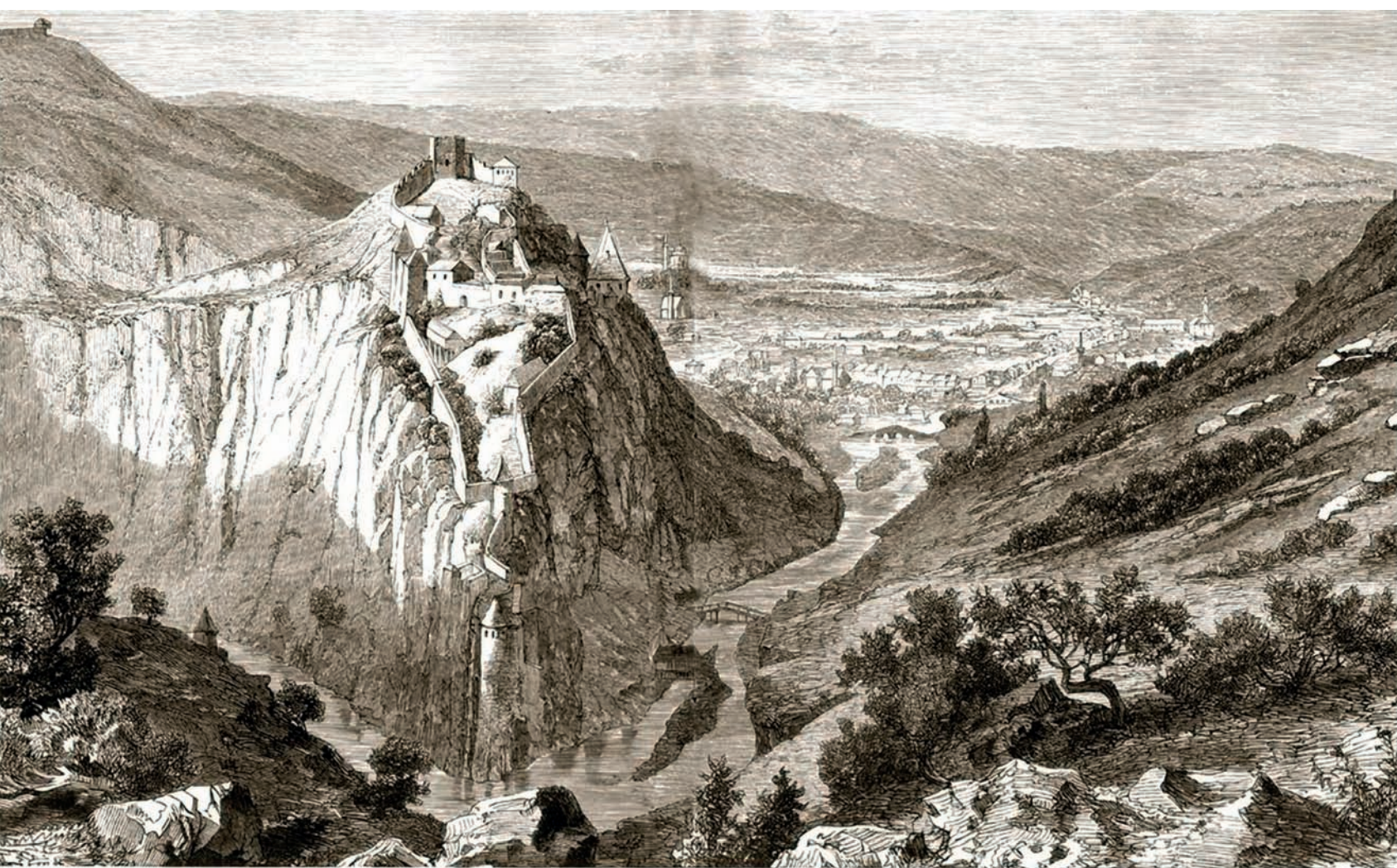
UZIČE VOR SEINER ZERSTÖRUNG. (1862.)